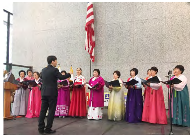
<2020.1.13 '미주 한인의 날' 행사에서 연주>