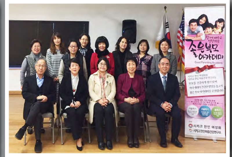
2019.12.5 좋은부모 아카데미 가을학기 종강식