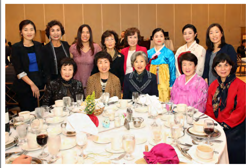
2019.10.6 문화회관 기금마련 디너에 참석