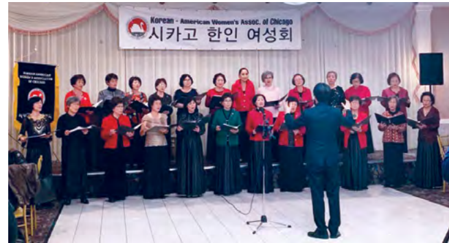
<2019.12.6 여성회 연말파티에서 연주>