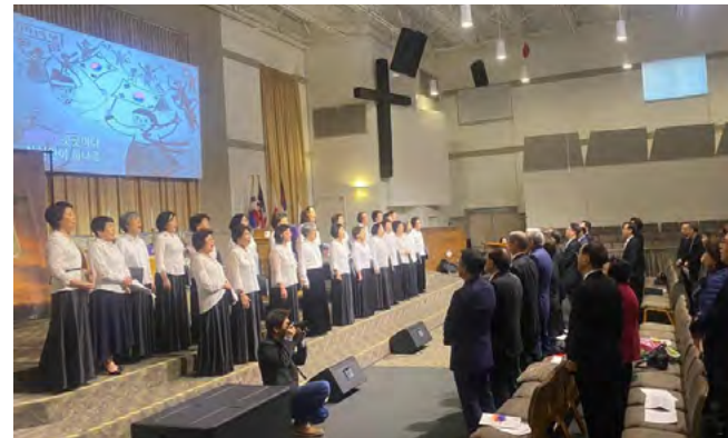
<2020.3.1 '삼일절 기념식'에서 연주>