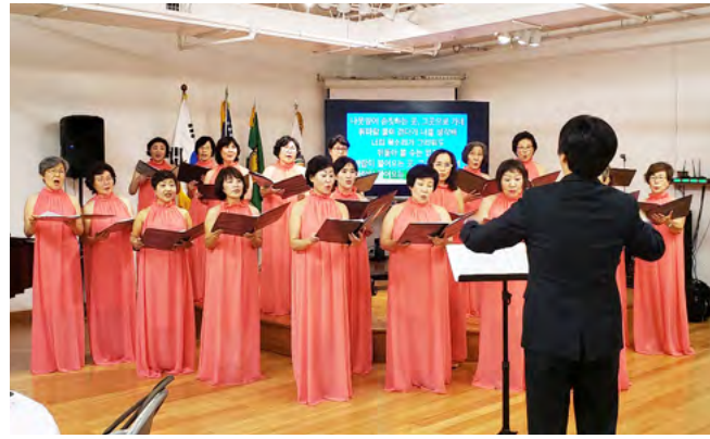
<2019.9.12 여성회 가을 이사회에서 연주>

팬데믹 후 연습 시간과 장소: 매주 월, 오후 7시 (문화회관 행사장) 문의: (773) 396-2609 | jaeran1006@gmail.com